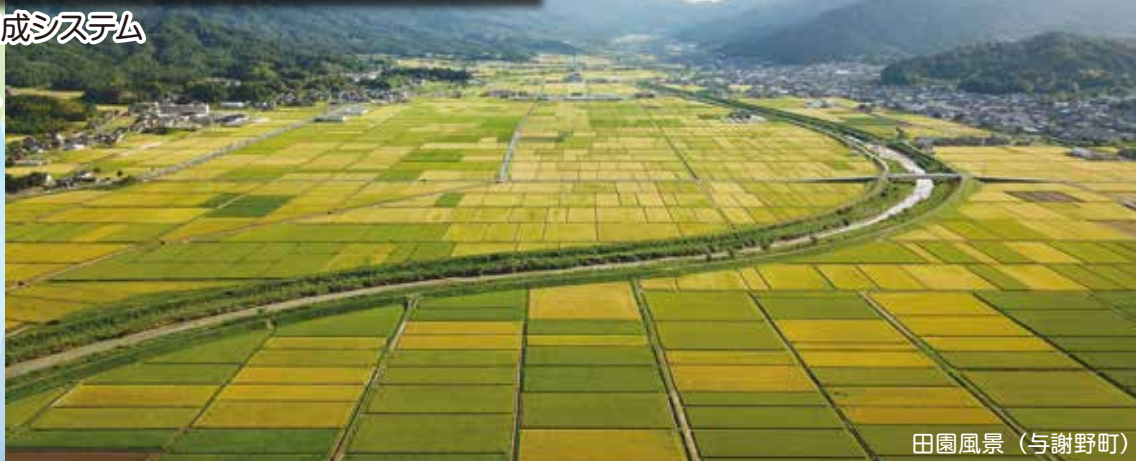
田園風景（与謝野町）