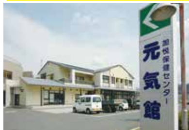
与謝野町加悦保健センター 元気館 京都府与謝郡与謝野町字加悦204番地